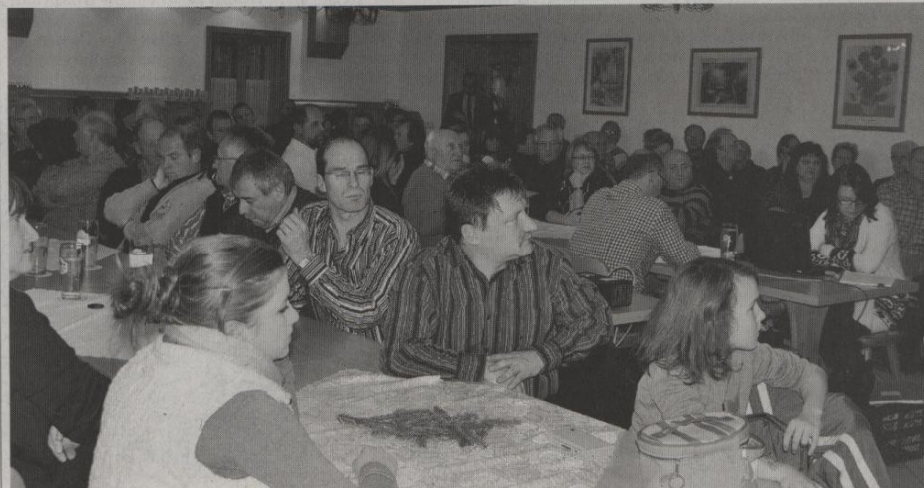
Großes Interesse herrschte zum Thema „Seniorenheim – Ja oder Nein?“