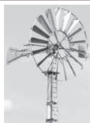
Weithin sichtbar: Das Windrad bei einem der Anwesen im Weilnbachtal.