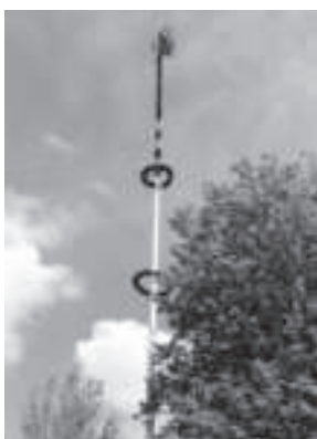
Der Maibaum ziert die Dorfmitte Frichlkofens. Aufgestellt wurde er auch heuer von der Freiwilligen Feuerwehr, die diesen Brauch gerne pflegt.

Kaum waren die Worte des Bräu gesagt - schon wurden die beiden Biersorten ausgeschenkt und man stieß gemeinsam auf schöne Festtage in Frichlkofen an.