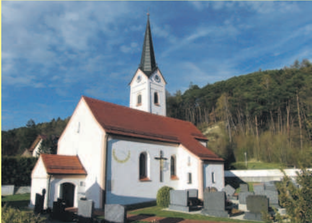
Die Kirche St. Laurentius ist prächtig anzuschauen und hat an ihrer Außenmauer sogar eine Sonnenuhr.

Filialkirche ist dem Heiligen Laurentius gewidmet