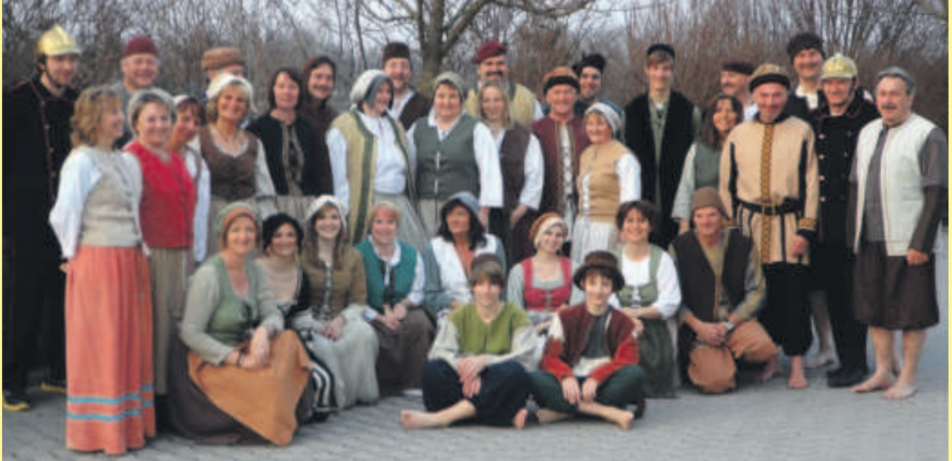
Die Dorfgemeinschaft hat sich für das Festwochenende entsprechend mittelalterlich gewandelt.

Dorfgemeinschaft Frichlkofen lädt zum Historischen Fest ein Am Samstag und Sonntag, 19./20. Mai, mit buntem Programm für die ganze Familie