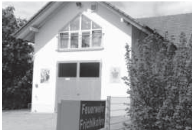
Am Dorfplatz, durch den sich der Weilnbach schlängelt, und am Feuerwehrhaus wird das Historische Fest stattfinden.

Besuchen Sie das historische Fest in Frichlkofen!